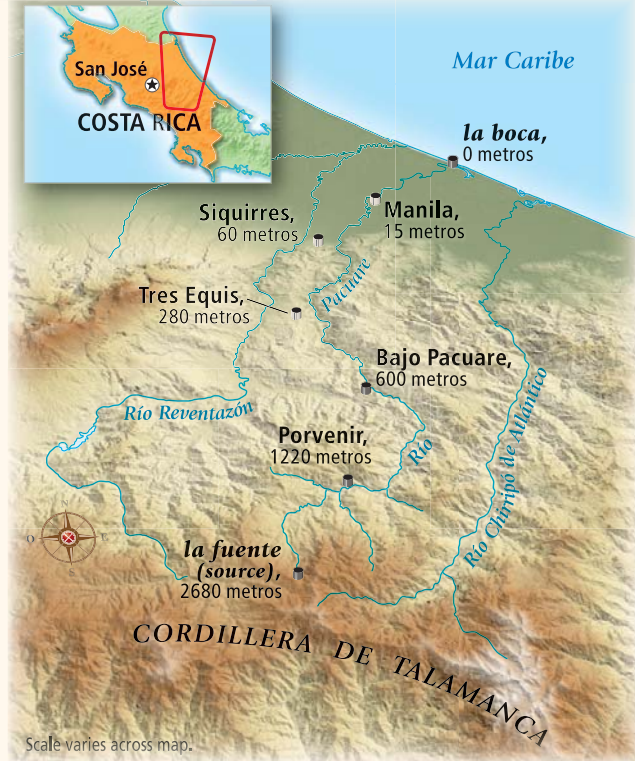
El río Pacuare