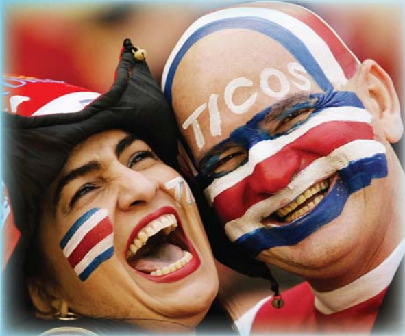
Aficionados de fútbol celebrando

Las aguas termales En Costa Rica hay muchos lugares bonitos donde las personas pueden pasar un rato en la naturaleza. En el resorte de Tabacón en Arenal, Alajuela, uno puede caminar por jardines tropicales, observar el volcán activo de Arenal y jugar en las aguas termales ( hot springs ). ¿Adónde van los turistas en la región donde vives? ▶