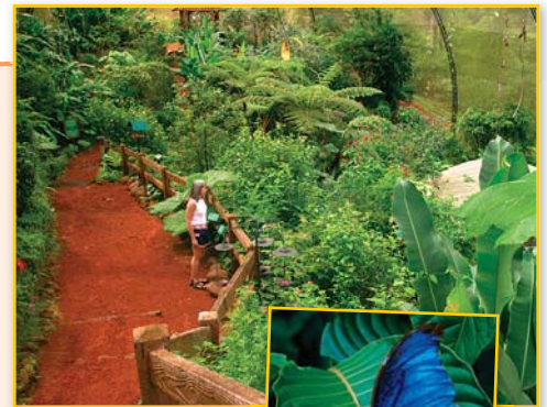
Observatorio de mariposas, Costa Rica, y la mariposa morfo azul.

B Voy a dibujar las cataratas. Voy a darte el dibujo.