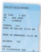
la tarjeta de embarque