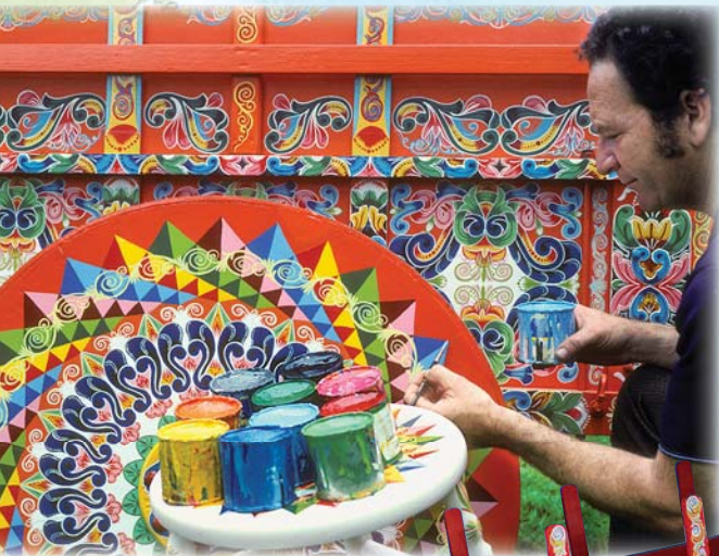
Artista pintando una carreta