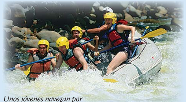
Unos jóvenes navegan por rápidos en el río Pacuare.

Hay muchos grupos dedicados a la conservación del río Pacuare. Investiga sobre el río Pacuare y escribe un párrafo sobre su importancia. ¿Cómo es el río? ¿Por qué es importante para la economía de Costa Rica?